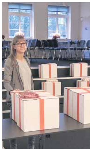
Julehjælp klar til afhentning i missionshuset i 2019.

"Ud over hygge, kaffe og julesange giver arrangementet en ekstra mulighed for at snakke og lære hinanden at kende, så vi LM'ere og ansøgerne snakker naturligt sammen, når vi mødes i byen," forklarer hun.