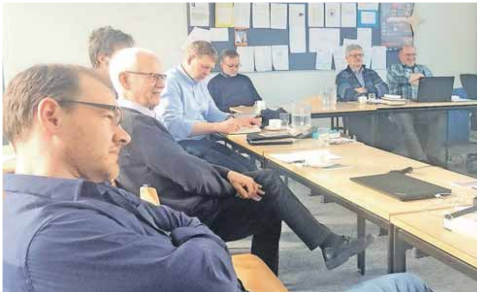
Lærerådet slog fast, at forkyndelsen af synd ikke må give tilhøreren indtryk af manglende værdi.

"Vi skal tale om dette, fordi der er en forbindelse mellem skam og skyld. Vi er gode til at forkynde om, hvad det vil sige at være skyldige. Men vi er ikke så gode til det med skam," mente vicegeneralsekretæren, der i en studieorlov i slutningen af 2017 og starten af 2018 blandt andet