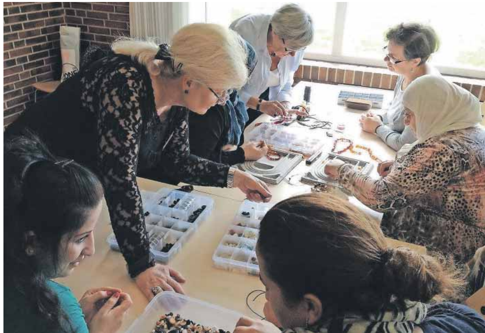
I LM er der mange fællesskaber med plads til mennesker på tværs af etniske og religiøse skel – som her "Kvinder møder kvinder" i Haderslev.