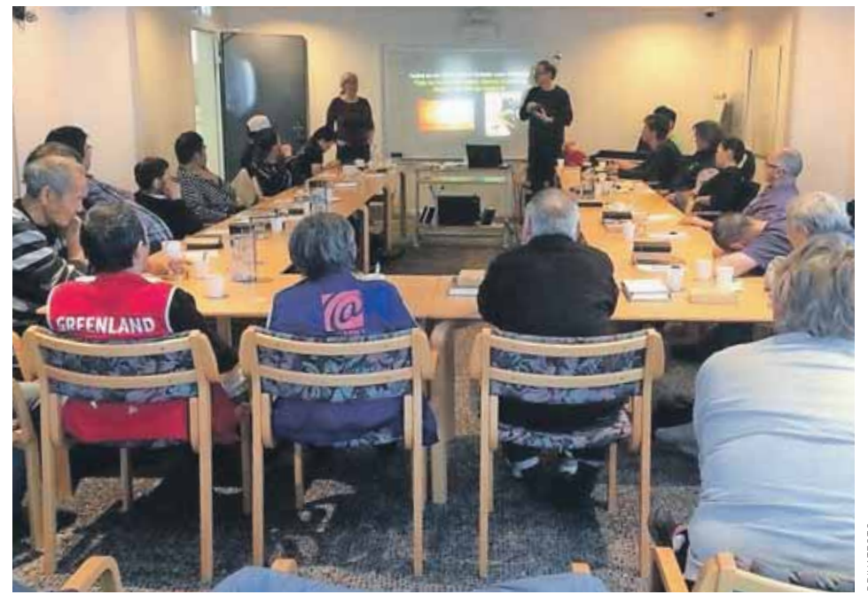
Alle 25 pladser på kristendomskurset for hjemløse i Nuuk er fyldt op.

Nu har sømandsmissionæren også startet et kristendomskursus for de hjemløse. Kurset bliver oversat til grønlandsk og er kun for tilmeldte, og hvor han første gang kun holdt 12 pladser åbne, er der denne gang 25 pladser, der alle er fyldt op.