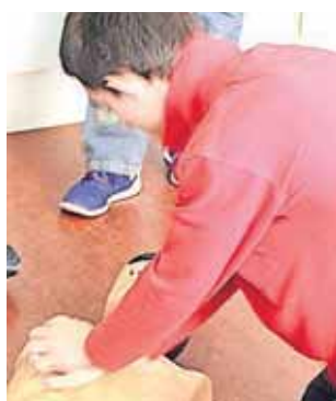
"Må jeg lige få det dér?" siger en blond dreng med et glimt i øjet og peger på kortet.

Han har ikke heldet med sig, for læreren går videre med det samme: