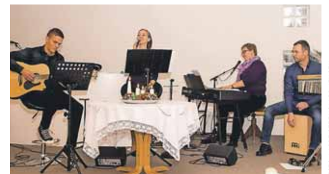
Lovsangsteamet i Kirken ved Søerne i julen 2016.

"Det ligger dybt i menighedens medlemmer, at gudstjenesten begynder kl. 10.30, og jeg erkender, at det ikke er sådan lige at få dem til at komme en halv