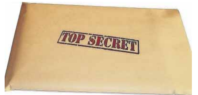
Alle tre aldersgrupper i LMBU samler i år ind til mission i Mellemøsten. Af sikkerhedsgrunde kan man hverken nævne navn på land eller personer på skrift.

"Og så tror vi også, at kendskab til kristne kirker rundt omkring i verden kan være med til at udfordre og inspirere os i den måde, vi