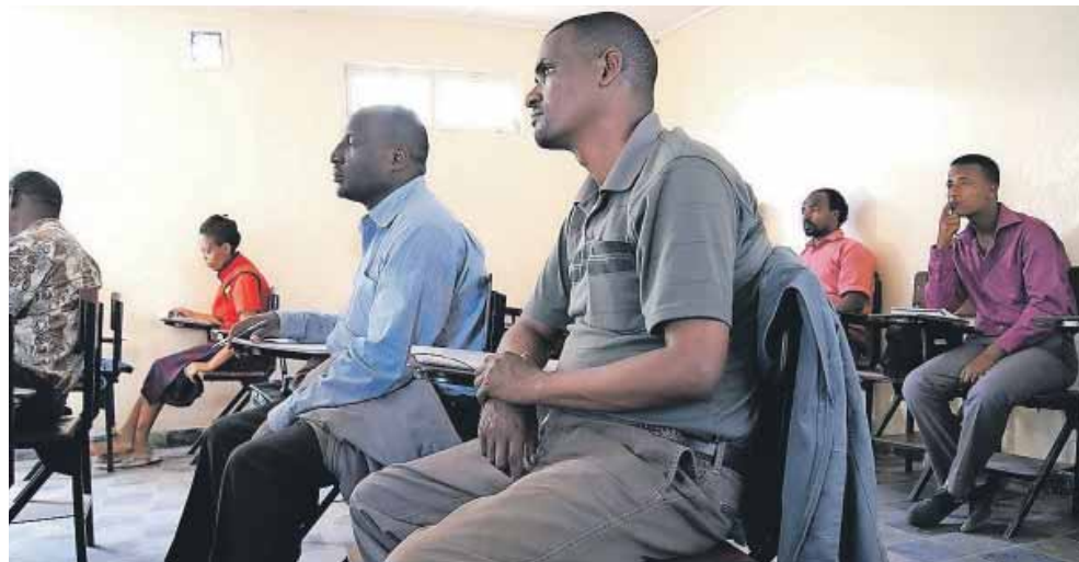
På Tabor Evangelical College kan nuværende og kommende kirkeledere få undervisning.

Selvom det kun er en eller to generationer siden, at