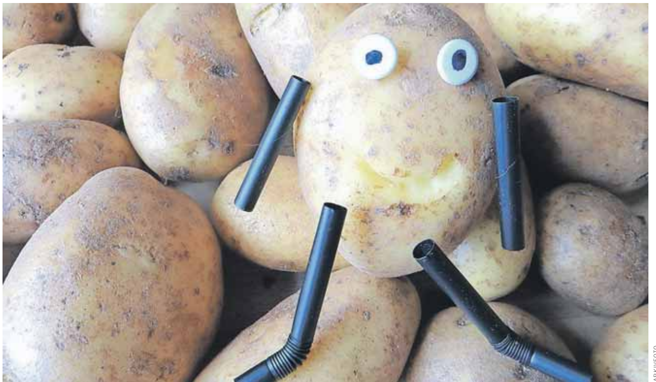
Peru er kendt som "kartoflernes land", og mange af de indsamlingsaktiviteter, som LM Kids foreslog, involverede kartofler.