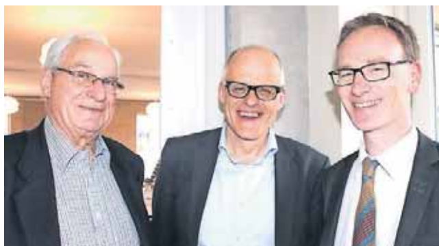
Ved jubilæumsfesten medvirker LM's tre generalsekretærer.

Deltagerne ved jubilæumsfejringen får også et indblik i, hvordan det var at være barn i LM i en tid, hvor man