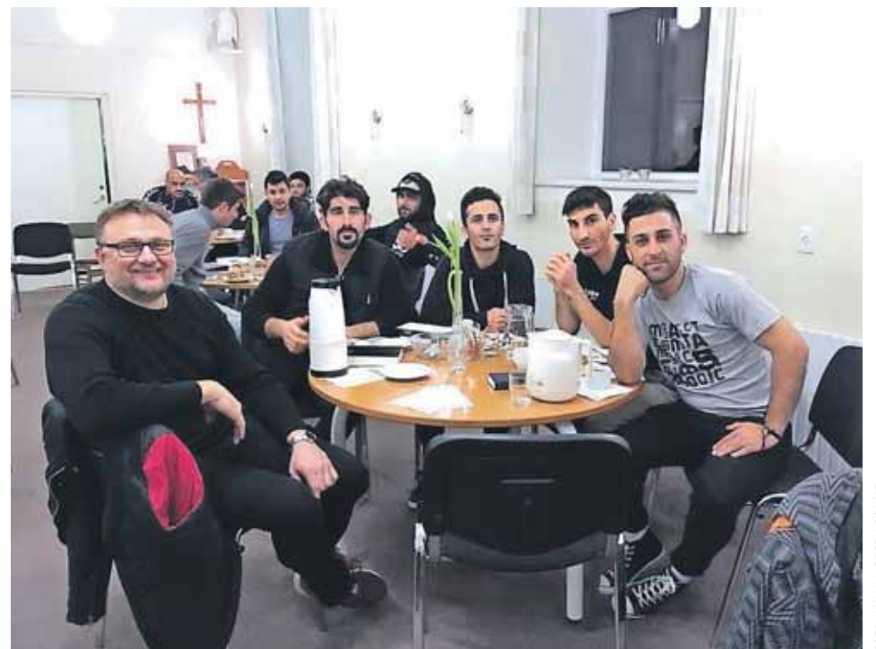
Over 50 mennesker fra Udrejsecenter Kærshovedgård – flest unge mænd – deltager i den ugentlige bibelcafé i Indre Missions hus i Bording.

Jeg har fået tilsendt en del sange på farsi fra Apostelkirken i København og fra Nørrelandskirken i Holstebro. Jeg hører sangene på