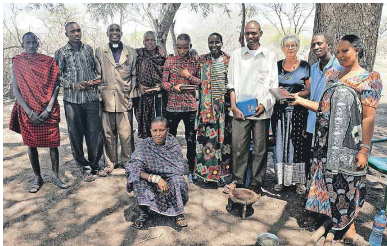
Lederen af bopladsen i Tungamalenga, manden i den hvide skjorte lige efter hans dåb.

Da han er en indflydelsesrig mand med mange tillidsposter i lokalsamfundet, lytter mange til ham.