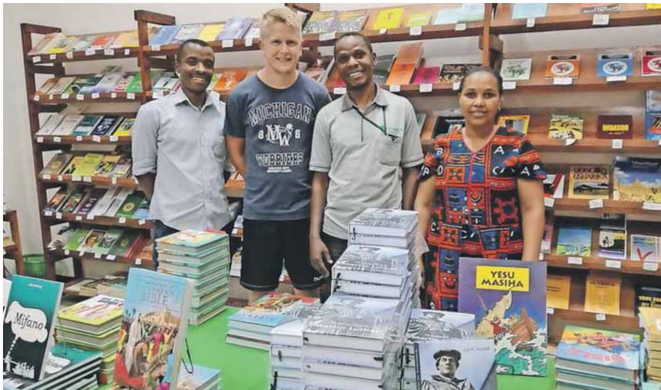
Sangbøgerne skal distribueres på samme måde som SB's øvrige bøger via mobile bogsalg og butikker som denne i Arusha.

"Jeg tror, at den blåstempling fra kirkens side betyder, at vi kan få flere af vores bøger ind i kirken og dermed få mulighed for at præge den teologisk."