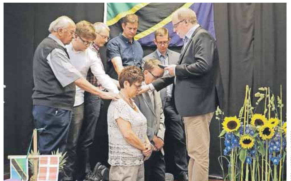
Der var udsendelsesfest for parret søndag den 11. juni på Efterskolen Solgården.

"Det bliver fantastisk at få lov til at komme ud i stiftet og møde kvinderne. At tale med dem og høre, hvad kvinderne er optaget af," siger hun og forklarer, at hun vil føle sig frem for at finde ud