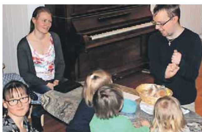
Hver anden gang har bibelgruppen undervisning for børnene.

Gruppen blev hurtigt enige om at begynde klokken 17 og slutte klokken 20 for at overholde børnenes almindelige spise- og sovnetider.