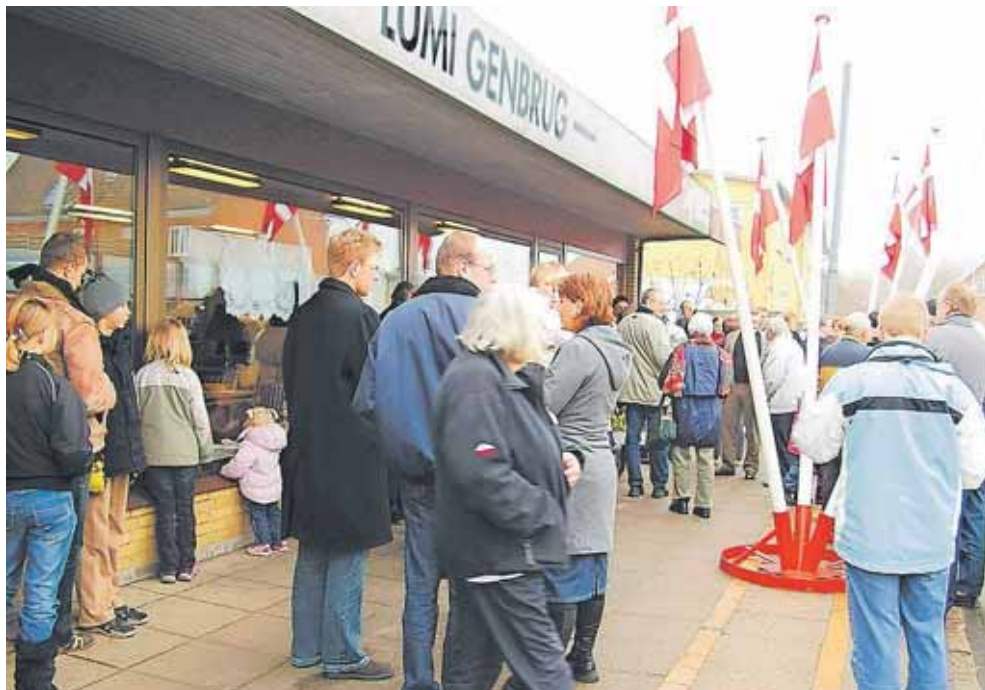
Den første LUMI Genbrugsbutik blev åbnet i Agerskov den 1. april 2006.