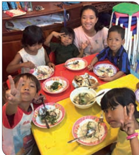
Fra Metta Mission

Siden ankomsten til Phnom Penh har Turið's primære opgave været at sørge for