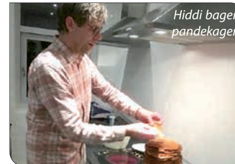
Hiddi bager pandekager

Jeg er med til LMUmøderne ca. en gang i måneden, hvor jeg prøver at komme så naturligt som muligt ind i fællesskabet. Ofte er jeg bare med, uden at have opgaver, hvor jeg bare får smalltalket lidt med