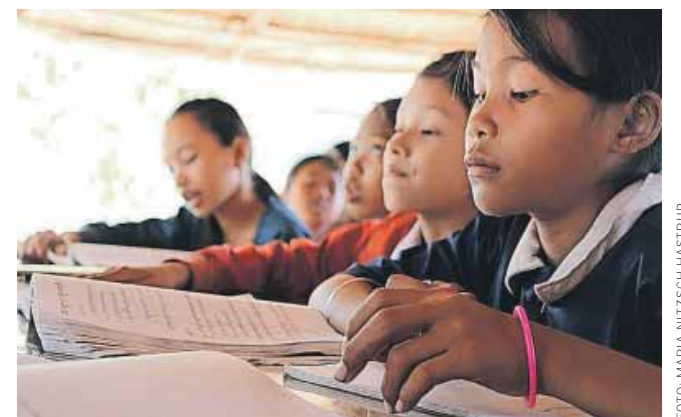
Stadig flere virksomheder udarbejder strategier for, hvordan de kan handle globalt og samfundsmæssigt ansvarligt. En af dem er JPS Marsells A/S, der støtter skolegang for fattige børn i Fjendeskoven i Cambodja.

"Hvis vi som virksomhed går foran i det her, så kan det måske være til inspiration for andre at gøre det samme," siger han. kbr