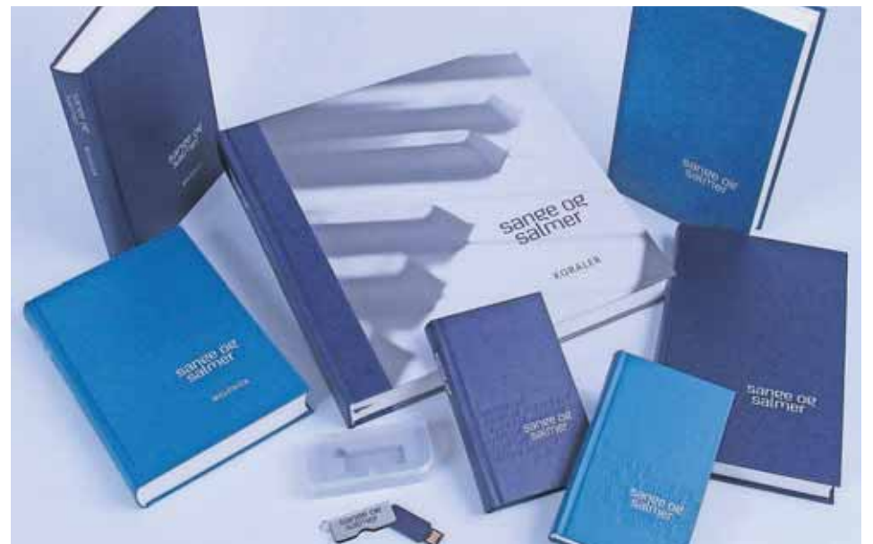
Den fælles sangbog Sange og Salmer findes i mange forskellige udgaver.

Spørgsmålet var dog også, om man overhovedet havde brug for en egentlig sangbog i en tidsalder, hvor man mange steder viser sangene på en storskærm. Det endte dog med, at man vurderede, at der stadig var behov for trykte sangbøger, og at en sangbog desuden sender et særligt signal: