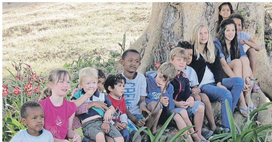
To volontører havde gjort et stort arbejde med at planlægge et program for børnene.

På baggrund af en grundigt udarbejdet evalueringsrapport, udført af både missionærer og etiopiske kollegaer fra Mekane Yesus Kirken, blev der ført en lang drøftelse af de forskellige arbejdsgrøene. Samtalerne foregik i