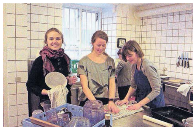
Forberedelserne i køkkenet er i fuld gang.

ret, at alle også skulle have noget socialt sammen med gæsterne.