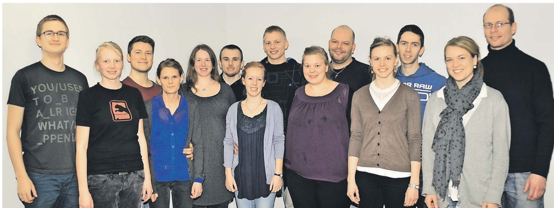
Syv unge ægtepar fra IMU, LMU og KFS deltog i udrustningsdagen den 2. marts for dem, der står bag projektet Kærestesnak.

LMU og IMU giver hjælp til at gøre kærestetiden til en god tid