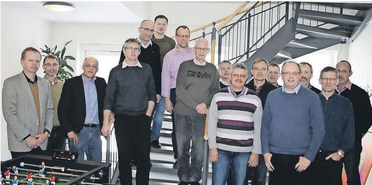
LM's Læreråd består af Landsstyrelsen og formændene for de syv landsdels-afdelinger.

Lærerådet afsluttede to år lang proces med at vedtage en række pejlemærker for troen