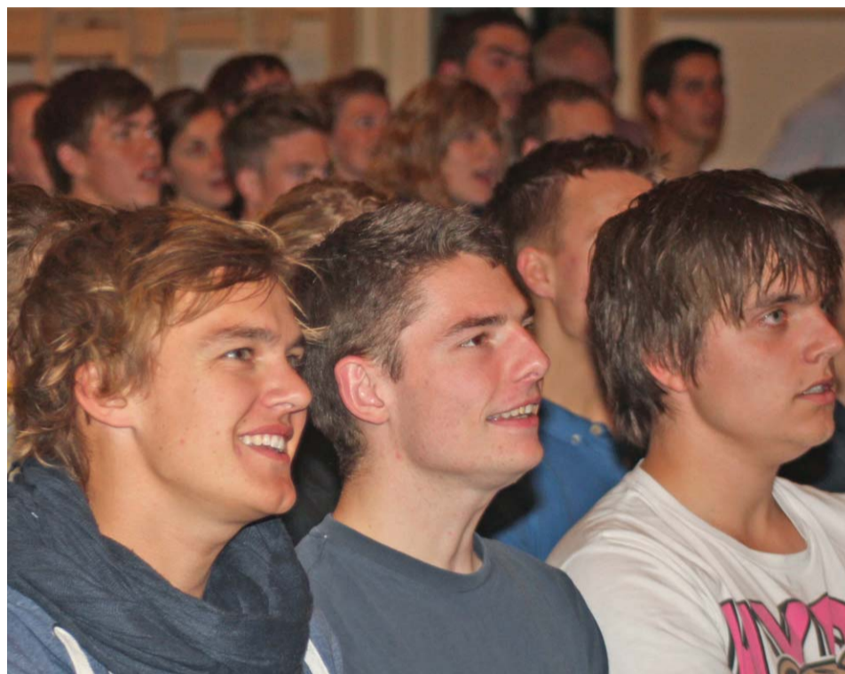
125 engagerede unge sugede til sig i bibeltimer, foredrag og ved lovsangen.

De to kvinder var enige om, at det bedste ved kurset var at få fyldt på ved bibeltimerne - ligesom de var glade for, at der også var nogle fokus-