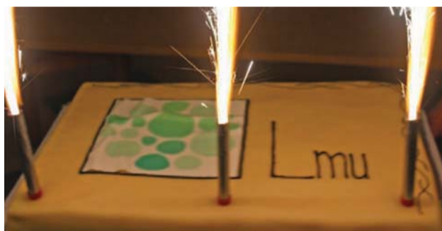
Forkælelse af LULK-deltagerne fortsatte ved festmiddagen lørdag aften, der sluttede af med LMU-lagkager.

• Gud bruger syndere i sit arbejde, for at de kan være vidnesbyrd om hans nåde.