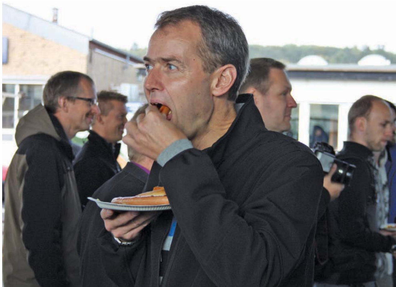
300 sultne mænd i kø for at mæske sig i pølser med brød, syltede agurker og dyppelse.

Dagens formål var at genskabe den maskuline mand, der er aktiv i ægteskabet, nærværende i familien og deltagende i kirken.